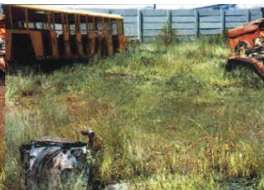
6 meses después