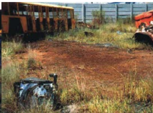
Después de la aplicación de Bio - Matrix