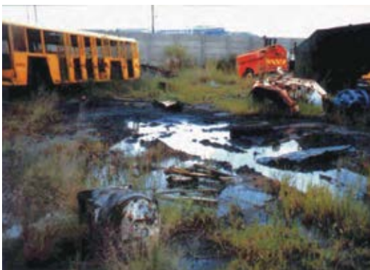
Derrame de aceite